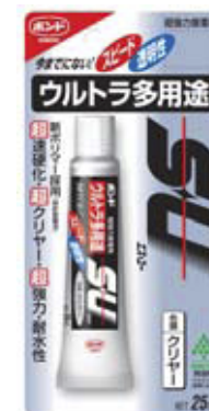
シリル化ウレタン 樹脂系接着剤

取付けの際の接着剤はコニシ株式会社製のボンドウルトラ多用途SU(エス・ユー)色調クリアーをおすすめします。 小売店でお買い求め下さい。